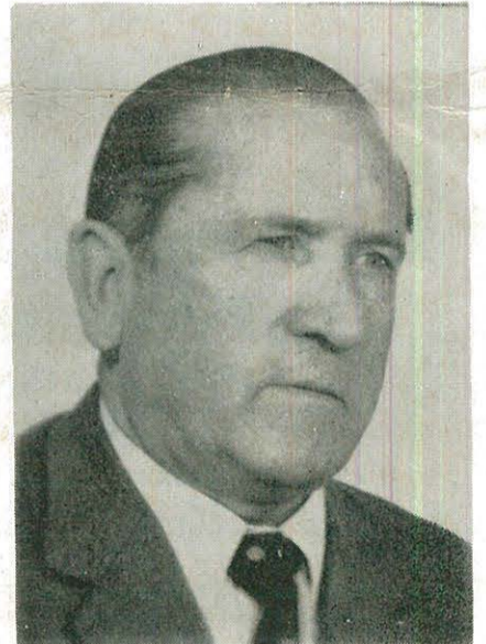
té de Cuenca y del Círculo Cultural "VAZQUEZ DE MELLA".