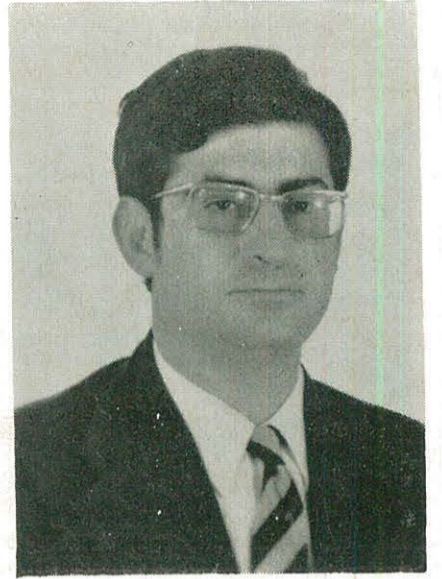
Miembro de la Hermandad de Alféreces Provisionales, como Alférez de Infantería procedente de la I. P. S.

Director de Equipo de Acción Local, titulado por el Centro de Estudios del Movimiento y Secretario del Departamento de Política Local.